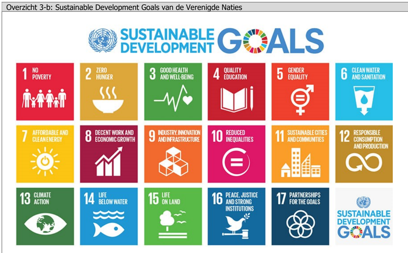
Overzicht 3-b: Sustainable Development Goals van de Verenigde Naties